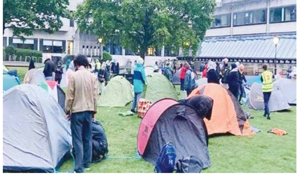
○ المخيم التضامني مع الشعب الفلسطيني في كلية ترينيتي بدبلن.

دبلن - الوكالات: نصب طلاب من كلية ترينيتي المرموقة في دبلن مخيما في حرم الجامعة احتجاجا على العدوان الإسرائيلي على غزة، وأغلقوا أمس مدخل مبنى عادة ما يستقبل الكثير من السياح. ووصف المحتجون تعبئتهم بأنها «مخيم التضامن مع فلسطينيين، في أعقاب تزايد تجمعات مماثلة في أوروبا والولايات المتحدة. وقال رئيس اتحاد الطلاب بالجامعة، لازلو مولنارفي، لفتاة «لا تي أي، التلفزيونية إن المحتجين يطالبون الجامعة بقطع علاقاتها مع إسرائيل. وذكرت المؤسسة في بيان: «يوجد معسكر غير مرخص لـ BDS (حركة تدعو إلى مقاطعة إسرائيل) في ترينيتي». وأشار إلى أنه «لضمان الأمن، سيقتصر دخول الحرم الجامعي على الطلاب والموظفين والمقيمين وأعضاء القسم الرياضي»، مؤكدا أن دخول الزوار كان محظورا أمس. وأضافت المؤسسة في البيان: «إذ تدعم جامعة ترينيتي حق الطلاب في الاحتجاج، لكن يتعين تنظيم الاحتجاجات ضمن قوانين الجامعة، وتتوسع التعبئة الطلابية