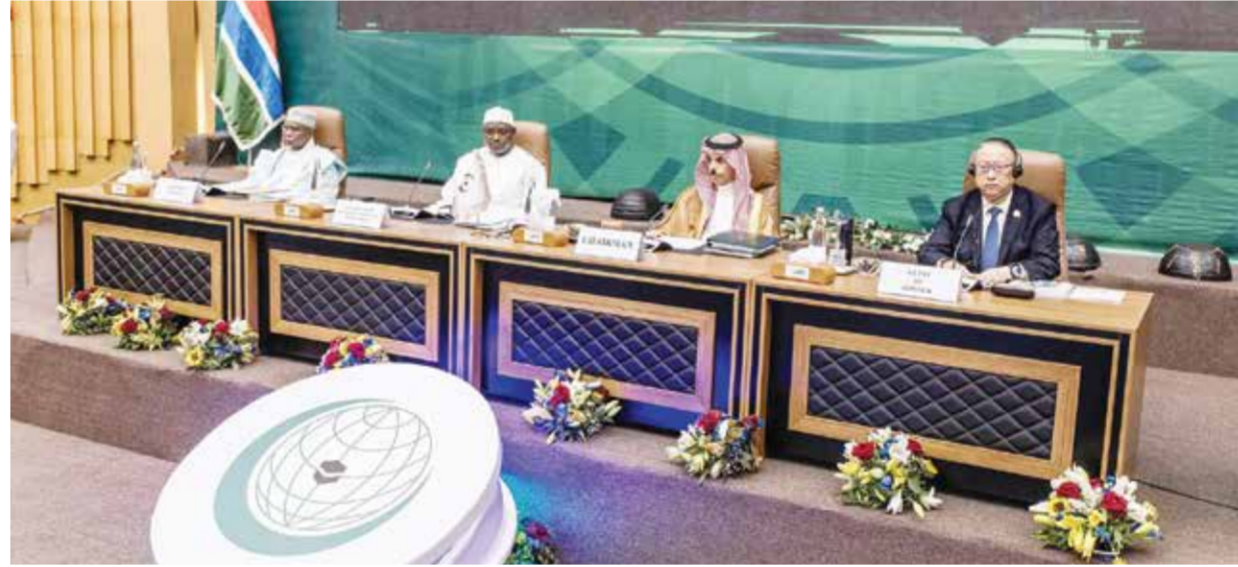
○ افتتاح القمة الإسلامية في بانجول.

بانجول - (أ ف ب): شارك عشرات القادة والزعماء من الدول الإسلامية أمس السبت في الدورة الخامسة عشرة لمؤتمر منظمة التعاون الإسلامي في بانجول عاصمة غامبيا، ومن المتوقع أن يصدر قرار بشأن غزة في ختامها اليوم الأحد. وأعاد مراسلو وكالة فرانس برس بان الغالبية العظمى من زعماء البلدان الأعضاء في المنظمة البالغ عددها ٥٧ دولة أوفدوا ممثلين لهم إلى القمة، لكن عددا من رؤساء الدول الإفريقية، مثل رئيس السنغال، يشاركون شخصيا.