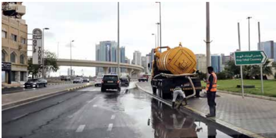
جهود متواصلة للجهات المعنية لشطف مياه الأمطار.

عدسات «أخبار الخليج»، انتشار صهاريج شطف مياه الأمطار في عديد من مناطق المملكة، ووجود عدد من مسؤولي وزارتي الأشغال وشؤون البلديات وأعضاء المجالس البلدية على المملكة، وأن المركز قام بتطبيق خطة الطوارئ المعدة لمواجهة الأمطار والأدوار المنوطة بالجهات المعنية ذات الاختصاص. وقد رصدت