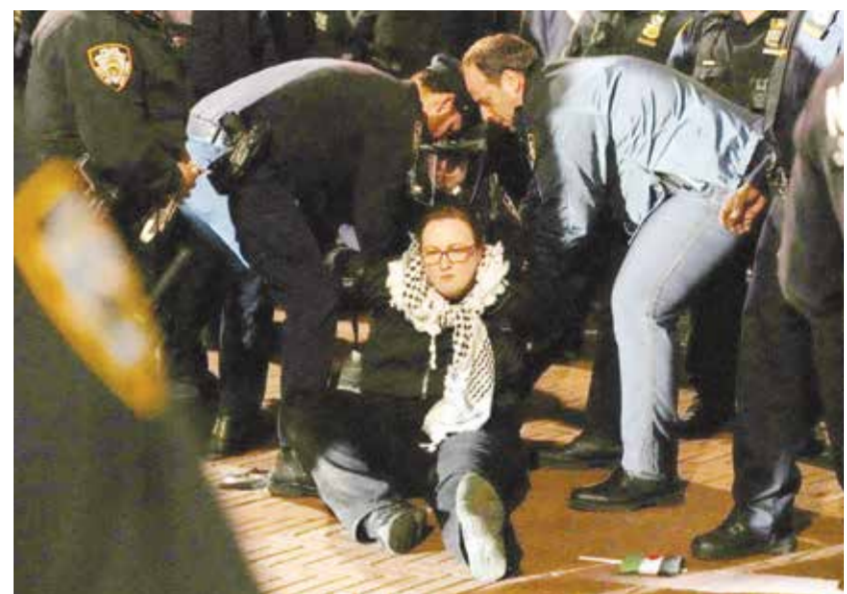
الشرطة الأمريكية تعتقل طلاباً متظاهرين مع الفلسطينيين.

عنيفة، ويرى الكاتب أن اليمين المتطرف صوّر الجامعات على أنها بؤر للمتعاطفين مع الإرهاب، وتهديد للقيم الأمريكية، الأساسية مثل حرية التعبير.