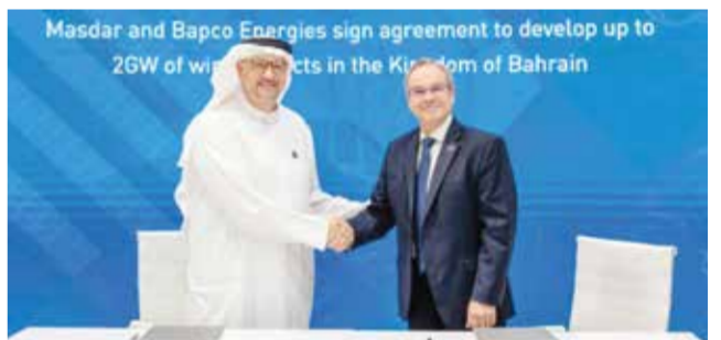
خلال توقيع الاتفاقية.