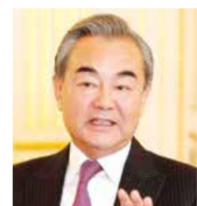
○ وزير الخارجية

التداعيات السلبية الناجمة عن الصراع، وذلك يمثل