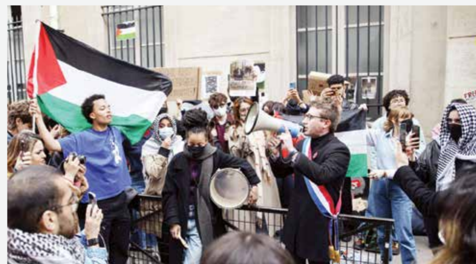
○ تظاهرة مؤيدة للفلسطينيين أمام معهد الدراسات السياسية في باريس.

المؤيدين للفلسطينيين، إذ نُظمت احتجاجات في عدد من الجامعات المرموقة عالميا مثل هارفارد ويال وكولومبيا وبريستن. أما في العاصمة الفرنسية فأطلق طلاب مداخل جامعة