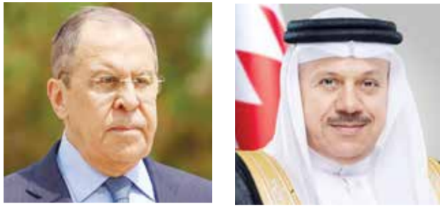
○ وزير الخارجية الروسية. ○ وزير الخارجية.