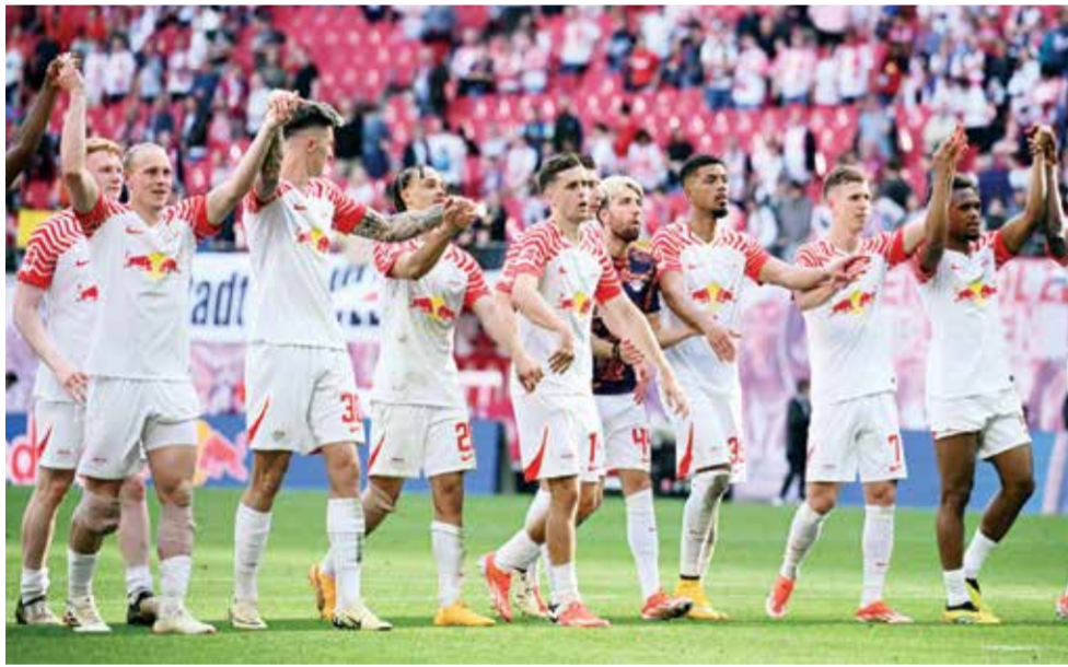
O فريق لايبزغ (رويترز)

برلين - (رويترز): قال الرئيس التنفيذي للأعمال في رازن بال شيبورت لايبزغ أمس الخميس إن النادي عازم على إنهاء الموسم ضمن المراكز الأربعة الأولى في الدوري الألماني لكرة القدم رغم احتمال تأهل صاحب المركز الخامس إلى دوري أبطال أوروبا الموسم المقبل.