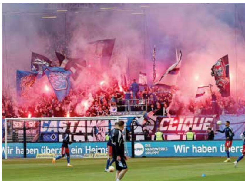
O من أعمال العنف في الملاعب الألمانية

وجرى إخطار المحكمة بأن هناك حاجة لما يصل إلى ٤٠٠ ضابط شرطة إضافي لحماية المباريات التي تتسم بمخاطر عالية، وبأنه يجب على المنظمين أيضاً المساهمة في التكاليف في دول أوروبية أخرى.