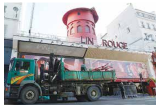
○ واجهة الملهى بعد الحادث.

سقطت صباح أمس الخميس مرواح طاحونة مالهى «مولان روج» الاستعراضي الشهير في حي مونمارتر الباريسي، في حين لم تتضح بعد أسباب الحادثة. وأفادت أجهزة الإغاثة وكالة فرانس برس بأن مرواح طاحونة الملهى الأبرز في باريس سقطت ليل الأربعاء إلى الخميس، مؤكداً بذلك معلومات أوردتها قناة «بي اف ام تي في». وسقطت أيضاً بعض الحروف (M, O, U) من اسم الملهى الظاهر على واجهته، وأوضحت أجهزة الإغاثة أن أحداً لم يُبلغ عن وقوع إصابات، مشيرين إلى أن خطر سقوط أي أجزاء أخرى قد يتبدد. ولم تعرف حتى الساعة أسباب سقوط المرواح والحروف، وفي حديث إلى وكالة فرانس برس، قال الطاهي في الملهى الاستعراضي مفضلاً عدم ذكر اسمه: «إن ما حصل مروّع، وفوجئ لدى وصوله عند الثامنة صباحاً إلى الموقع بأن المرواح قد سقطت أرضاً. وأشار قائد شرطة العاصمة لوران تونيز إلى أن «مهندسين مختصين بالسلامة يعملون لدى الشرطة، توجهوا إلى الموقع».