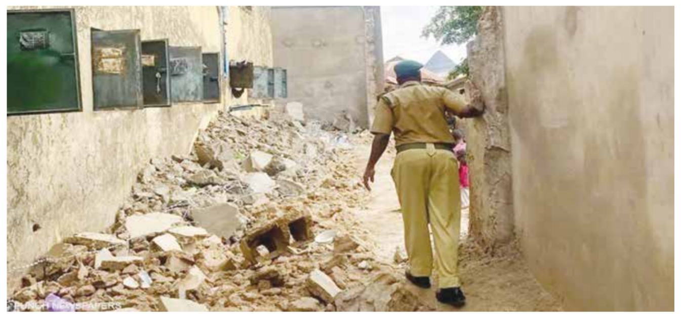
○ الأمطار هدمت جزءاً من سور السجن.

الهيئة الوطنية لعلوم الفضاء ويتعاونها المستمر مع أبرز الشركات الرائدة والمتخصصة في مجال المراقبة الأرضية، تنشر صورة لدرة البحرين وجزرها بتقنية التصوير الراداري بدقة ٥٠ سنتيمتراً، التي تم التقاطها من أحد الأقمار الصناعية التابعة لشركة كابيللا. شركة كابيللا الأمريكية رائدة في مجال توفير المعلومات