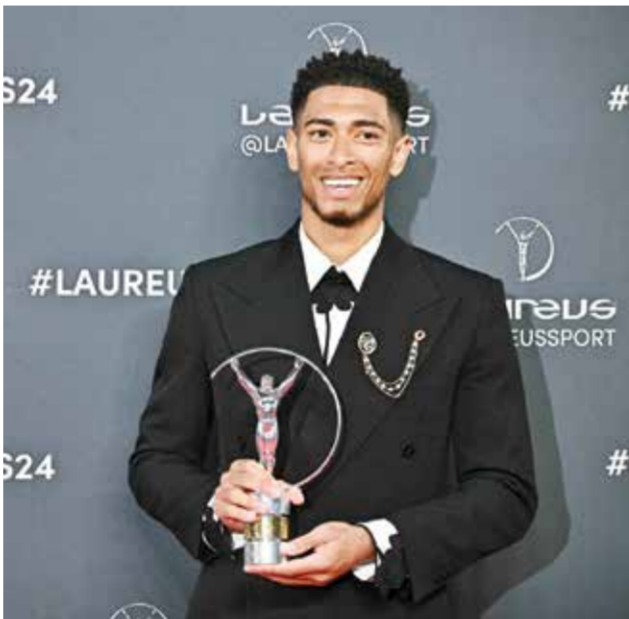
○ بيلينغهام (أ ف ب)