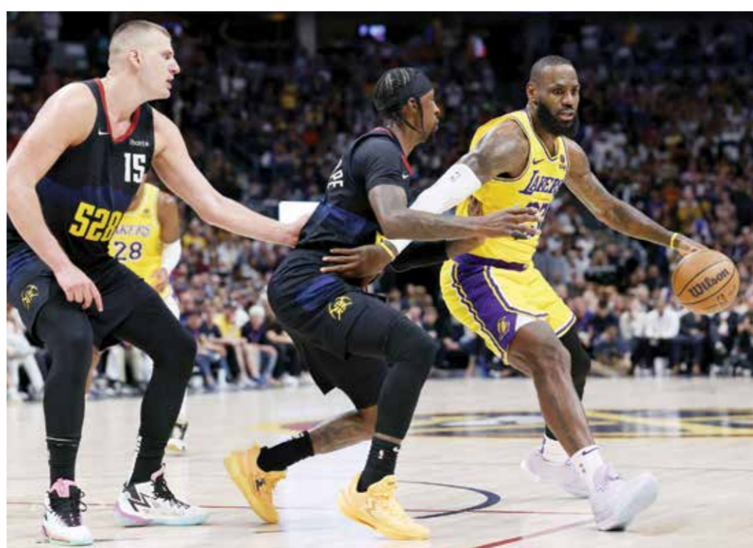
○ ليبرون جيمس يخسر أمام ناغتنس. (أ ف ب)

لوس أنجلوس - (أ ف ب): خطأ دنفر ناغتنس حامل اللقب خطوة إضافية نحو بلوغ نصف نهائي المنطقة الغربية ضمن بلاي أوف دوري كرة السلة الأمريكي للمحترفين «إن بي إيه» بعد تقدمه ٢-٠ على حساب لوس أنجلوس ليكرز بفوزه عليه ١٠١-٩٩ الاثنين، فيما هزم نيويورك نيكس نظيره فيلادلفيا سيكسرز بصعوبة كبيرة ١٠٤-١٠١ ليعزز ترققه.