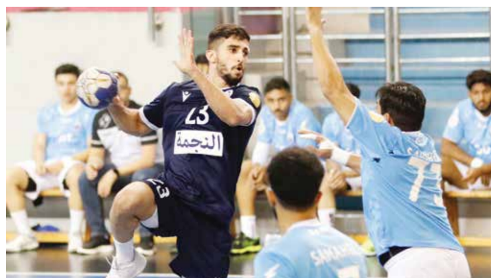
○ من لقاء النجمة وسماهيح

وفي اللقاء الآخر، ستكون الفرصة سانحة لأحد الفريقين الدير والبحرين للخروج بنتيجة الفوز بعدما خسر كل منهما بالجولة الماضية، سيكون الدير حريصاً على الفوز للمنافسة على المراكز الأربعة الكبار، ويمتلك الدير (١٦ نقطة) في المركز الخامس، بينما البحرين في رصيده (١٢ نقطة) في المركز الثامن.