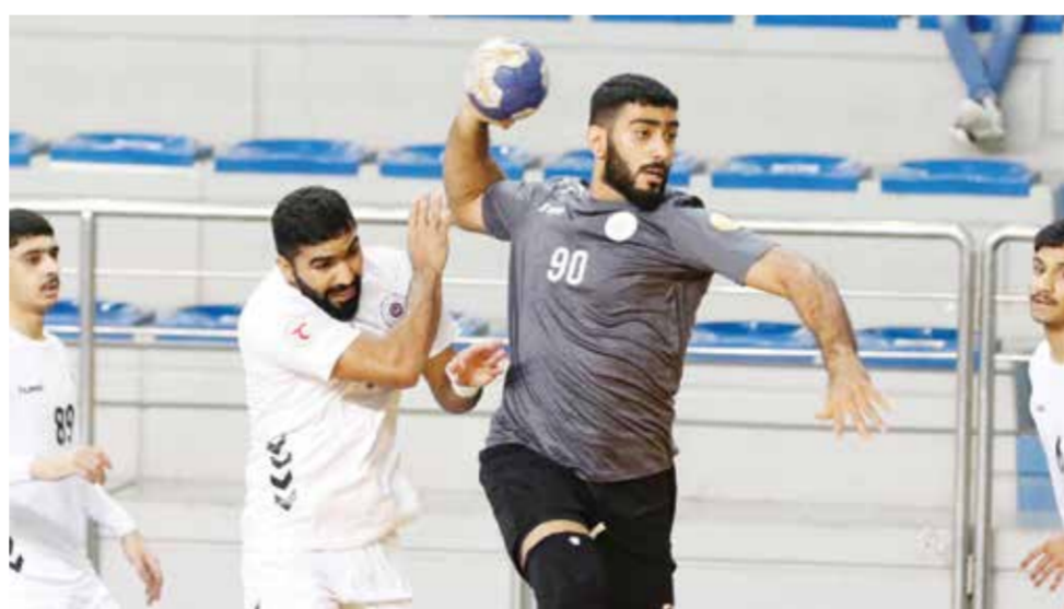
○ من لقاء التضامن وباربار