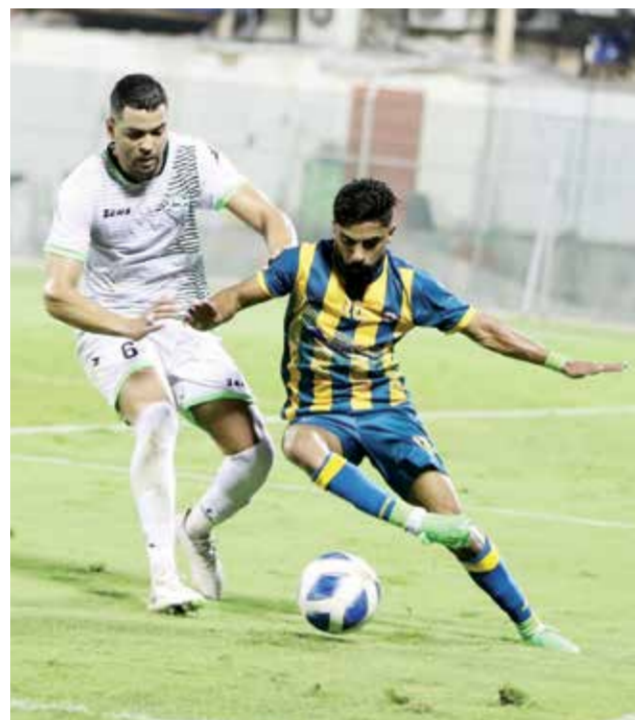
○ لقطة لفريق المالكية

فرقا عدة، بل ويبادر في تسجيل الأهداف، وكذلك أم الحسم الذي سيواجهه في المباراة الأخيرة يعتبر فريقا منظما، وفرق دوري الدرجة الثانية لا تختلف عن بعضها كثيرا. وأكد سيد محمد عدنان