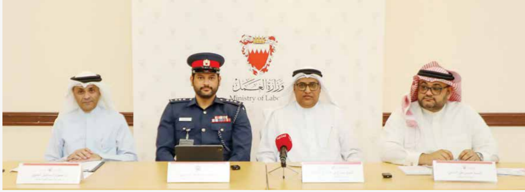
كتبت ياسمين العقيدات

إتاحة المستندات اللازمة للتسجيل خلال الفترة من ٢٠ إلى ٢٥ أبريل الجاري