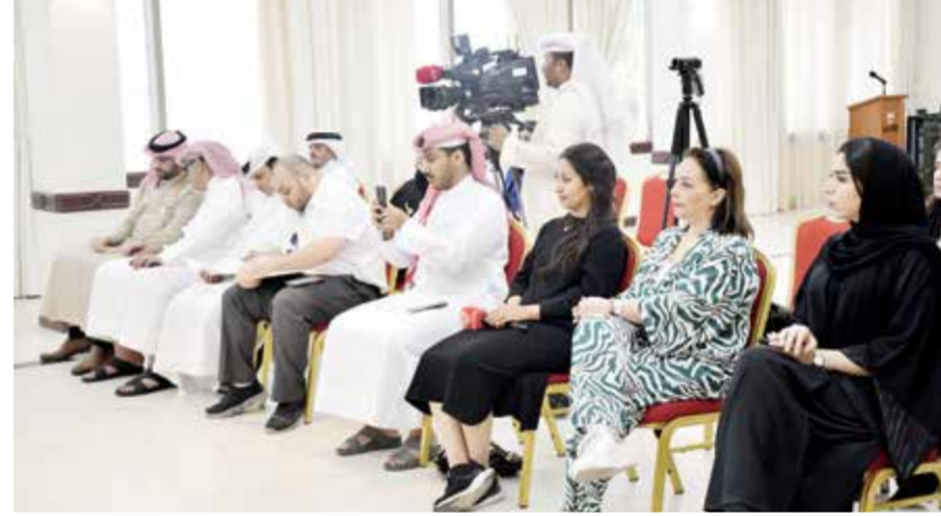
○ جانب من الحضور في المؤتمر الصحفي.

وأوضح أنه سيتم إرسال رسائل نصية للأفراد وذويهم، تدعوهم إلى الدخول على البوابة الوطنية في خدمة استعلام عن المواعيد بخدمات بطاقة الهوية للتحقق من مواعيدهم المحجوزة، لافتاً إلى أن المواعيد تم حجزها بصورة منظمة وتوزيعها على فترات صباحية ومسائية خلال الفترة من السبت ٢٠ أبريل حتى الخميس ٢٥ أبريل الجاري. وأشار إلى أن الهيئة ستقوم بتخصيص يوم السبت يوم عمل لضمان إنجاز طلبات الأفراد المشمولين بالعفو في مركز بطاقة الهوية بمدينة عيسى، وتهيئ الهيئة بضرورة الالتزام بالحضور وفق المواعيد التي تم جدولتها بصورة مسبقة بما يضمن انسيابية وسلاسة إنجاز الخدمة، منوهاً إلى أن المركز سيعمل طوال الأسبوع القادم خلال الفترة المسائية على استقبالهم وفق المواعيد المحجوزة لاستكمال طلباتهم وإنجاز معاملاتهم وتزويد من المعلومات يمكن التواصل مع مركز اتصال الخدمات الحكومية. وتابع: في حال امتلاكهم بطاقة هوية سارية الصلاحية يتوجب عليهم الحضور وفق مواعيدهم المحجوزة والتوجه إلى موظف الخدمة في مركز بطاقة الهوية بمدينة عيسى لاستكمال إجراءات تحديث بياناتهم وتسليمهم شهادة عدم الممانعة الصادرة عن وزارة الداخلية وهذا سيمكّنهم