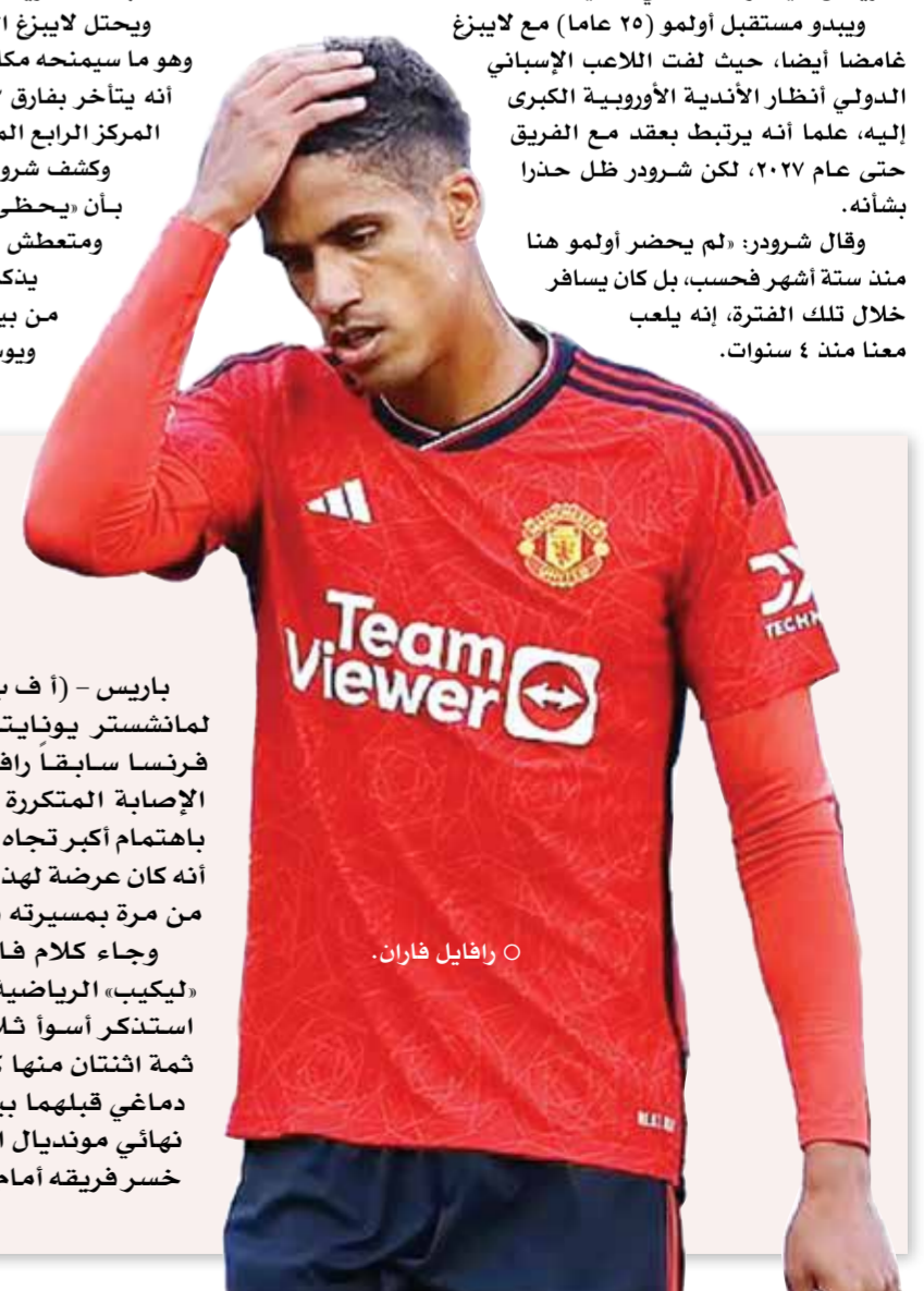
○ رافايل فاران.

وجاء كلام فاران في حديث لصحيفة «ليكيب» الرياضية الفرنسية بقوله «عندما استذكر أسوأ ثلاث مباريات في حياتي، ثمة اثنتان منها كنت قد تعرضت لارتجاج دماغي قبلهما بيومين» في إشارة إلى ربيع نهائي مونديال البرازيل عام ٢٠١٤ عندما خسر فريقه أمام ألمانيا ١-٠، وذهاب ثمن