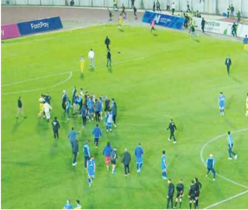
○ أعمال الشغب في المباراة.

بغداد - (أ ف ب): هددت إدارة نادي القوة الجوية متصدر الدوري العراقي لكرة القدم بالانسحاب من المسابقة في حال عدم اتخاذ اتحاد اللعبة قراراً حازماً وصارماً تجاه جماهير فريق نادي دهوك، إثر تعرض لاعبيه لمحاولات اعتداء أثناء مباراة الفريقين الأحد.