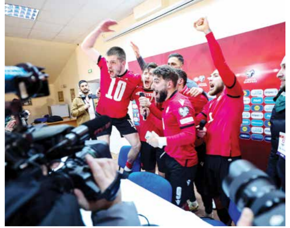
○ احتفال منتخب جورجيا (أ ف ب)

وستعيد البطولة مدرب منتخب جورجيا الفرنسي ويلى سانويل إلى ألمانيا حيث لعب في بايرن ميونخ في الفترة من ٢٠٠٩ إلى ٢٠٠٩.