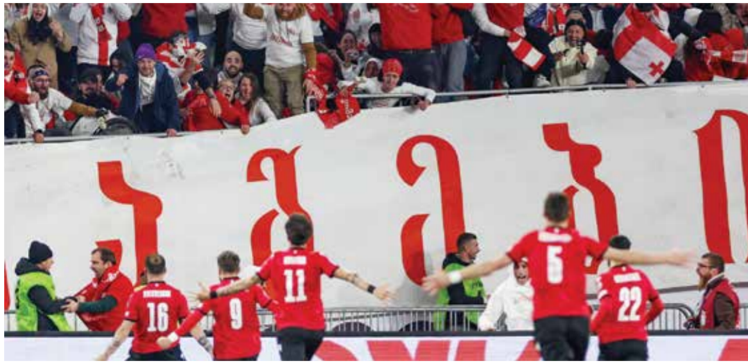
○ تأهل تاريخي لجورجيا

ويستهل المنتخب الهولندي بطولة أمم أوروبا التي تقام في ألمانيا يوم ١٦ يونيو بمواجهة المنتخب البولندي، علما بأنه سيواجه المنتخب الفرنسي والنمساوي في دور المجموعات.