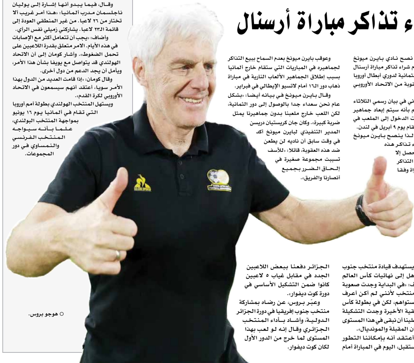
○ هوجو بروس.

الجزائر دفعنا ببعض اللاعبين الجدد في مقابل غياب ٥ لاعبين كانوا ضمن التشكيل الأساسي في دورة كوت ديفوار». وعبر بروس، عن رضاه بمشاركة منتخب جنوب إفريقيا في دورة الجزائر الدولية، وأشاد بأداء المنتخب الجزائري وقال إنه لو لعب بهذا المستوى لما خرج من الدور الأول لكان كوت ديفوار.