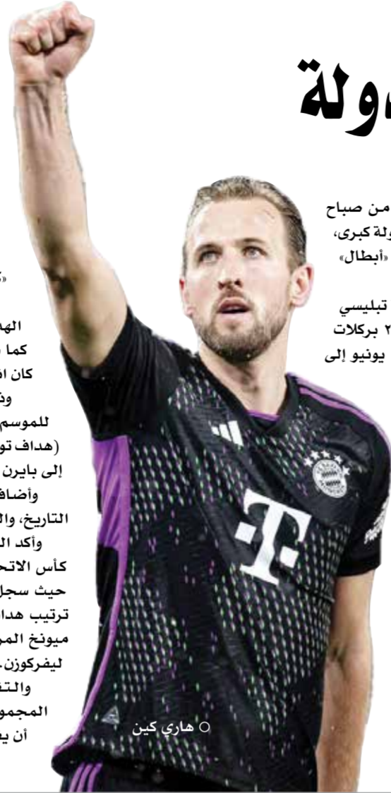
○ هاري كين

لندن - (د ب أ): يعود هاري كين، مهاجم فريق بايرن ميونخ الألماني لكرة القدم، إلى ملعب توتنهام لمواجهة فريقه السابق في أغسطس المقبل، وذكرت وكالة الأنباء البريطانية «بي.إيه. ميديا»، أن المباراة بين بايرن ميونخ وتوتنهام ستقام كجزء من كأس زيارة مالطا، يوم ١٠ أغسطس المقبل. وتشهد المباراة عودة هاري كين إلى شمال لندن، حيث كان هو الهدف التاريخي للفريق، بعدما انضم إلى بايرن ميونخ في الصيف. كما سواجه إريك داير، لاعب بايرن ميونخ، فريقه السابق أيضا حيث كان انتقل من توتنهام في يناير الماضي. وذكر توتنهام في بيان على موقعه: «هذه المباراة الافتتاحية المثيرة للموسم الجديد تكتسب أهمية خاصة، حيث ستشهد عودة هاري كين (هداف توتنهام التاريخي) وإريك داير إلى ناديهما القديم، حيث كانا انضما إلى بايرن ميونخ مؤخرا». وأضاف البيان: «ستكون هذه هي المواجهة رقم ١٣ بين الفريقين عبر التاريخ، والرابعة التي تقام في إنجلترا». وأكد البيان: «تغلبنا على العملاق الألماني في طريقنا نحو تحقيق لقب كأس الاتحاد الأوروبي قبل ٤٠ عاما». وقدم كين موسما رائعا في ألمانيا، حيث سجل حتى الآن ٣٧ هدفا في ٣٥ مباراة في كل المسابقات، ويتصدر ترتيب هدافي الدوري الألماني برصيد ٣١ هدفا حتى الآن. ويحتل بايرن ميونخ المركز الثاني في جدول ترتيب الدوري بفرق عشر نقاط خلف باير ليفركوزن. والتقى الفريقان في آخر مباراة في موسم ٢٠١٩/٢٠٢٠ في دور المجموعات بدوري أبطال أوروبا، حيث خسر توتنهام على أرضه ٧/٢ قبل أن يفوز بايرن ٣/١.