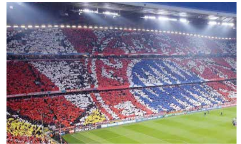
○ جماهير البايرن

وقال بايرن ميونخ في بيانه أيضا: «بشكل عام نحن سعداء جدا بالوصول إلى دور الثمانية، لكن اللعب خارج ملعبنا بدون جماهيرنا يمثل ضربة كبيرة». وكان جان كريستيان دريسن المدير التنفيذي لبايرن ميونخ أكد في وقت سابق أن ناديه لن يطعن ضد هذه العقوبة، قائلا: «للأسف تسببت مجموعة صغيرة في إلحاق الضرر بجمع أنصارنا والفريق».