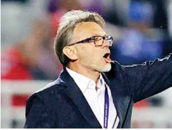
○ تروسييه