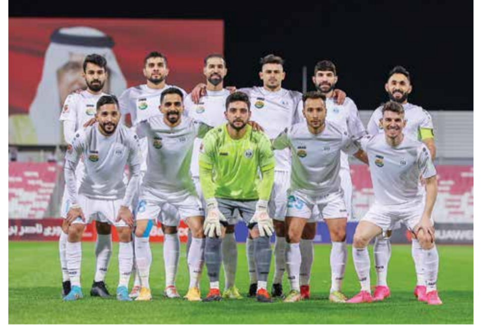
○ فريق الرفاع لكرة القدم

وأشار رئيس مجلس إدارة الاتحاد البحريني لكرة القدم إلى ما حققته البطولة على صعيد المتعة التنافسية والندية والإثارة في مباريات البطولة، علاوة على استقطاب المزيد من الجماهير بأرقام غير مسبوق، لتسجل هذه النسخة بحروف من ذهب في الذاكرة كإحدى أفضل لحظات كرة القدم الآسيوية، معرباً عن خالص الأمنيات للاتحاد الآسيوي لكرة القدم تحت قيادة الشيخ سلمان بن إبراهيم آل خليفة، في مواصلة العمل المميز وتحقيق المنجزات والمكتسبات التي تثرى عمل الكرة الآسيوية وتبرزها على الساحة الدولية، إذ جسدت كأس آسيا ٢٠٢٣، المكانة الرائدة لكرة القدم الآسيوية في جميع الأوساط.