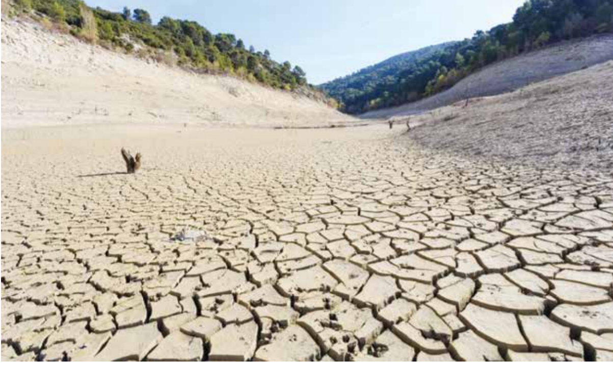
○ المغرب يصنف تحت خط ندرة المياه.