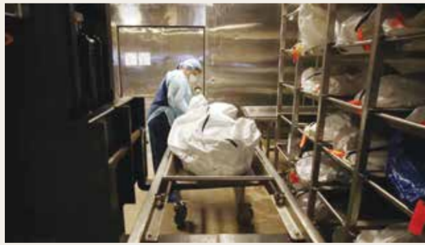
○ لجنة الأخلاقيات الطبية ستحقق في القضية.