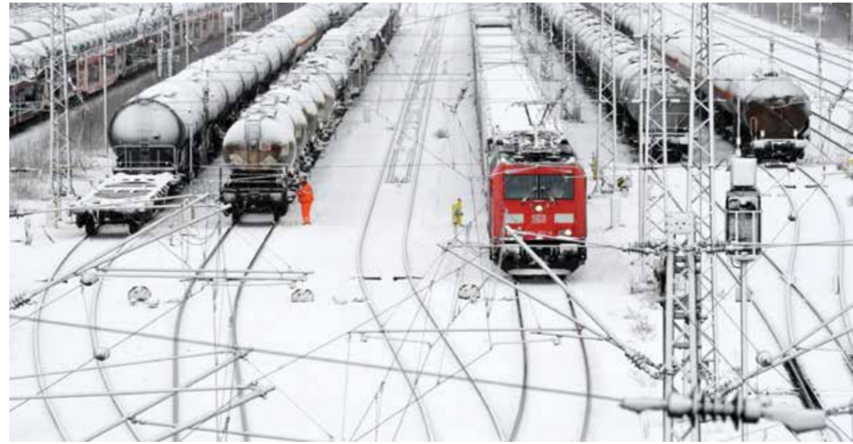
○ محطة قطارات تكسوها الثلوج في ميونيخ.

قالت شركة «دويتشه بان» الألمانية للسكك الحديدية وخطوط ميونيخ إن رحلات قطارات المسافات الطويلة ومئات الرحلات الجوية من وإلى مدينة ميونيخ الغيت، أمس السبت، بسبب تساقط الثلوج بكثافة. وأفاد بيان على الموقع الرسمي لمطار ميونيخ بأنه من المقرر ألا تغادر الرحلات أو تصل إليه حتى الساعة ١٢ ظهراً بالتوقيت المحلي على الأقل. وقالت «دويتشه بان» على موقعها الإلكتروني إن القطارات لم تتمكن من الوصول إلى محطة القطر المركزية في ميونيخ. وأضافت أنه من المتوقع أن يستمر التوقف طوال اليوم، ونصحت المسافرين بإعادة حجز رحلاتهم.