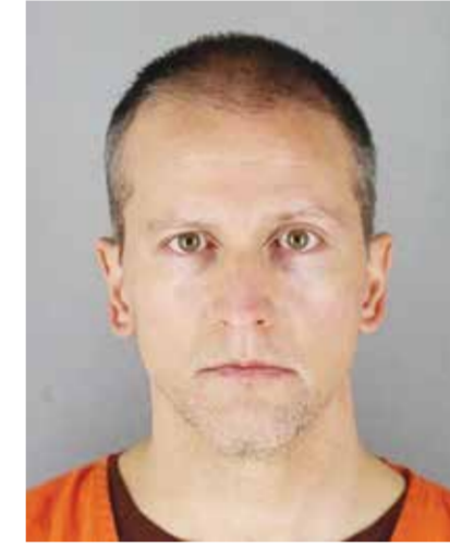
○ ديريك شوفين.