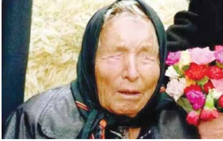
○ العرافة الضريرة بابا فانغا.

بالفعل في ١١ سبتمبر ٢٠٠١، الأمر الذي أثار علامات استفهام كبيرة بشأن ما وصفه البعض بالقدرة الخارقة، لهذه المرأة. وعلى الرغم من وفاتها في ١٩٩٦ عن ٨٥ عاما، فقد سبق أن توقعت خروج بريطانيا من الاتحاد الأوروبي، وكذلك تزايد عمليات تنظيم داعش في أوروبا، وهو ما تحقق بالفعل إلى حد الآن على الأقل