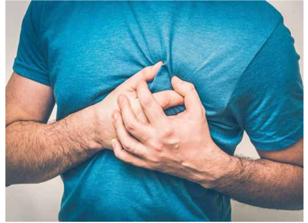
○ ظاهرة الإثنين الأزرق استعصت على التفسير.

أشارت دراسة حديثة إلى أن احتمال حدوث النوبات القلبية يكون أعلى بنسبة ١٣٪ في يوم الاثنين، أكثر من أي وقت آخر، ما يعني أن احتمالية الإصابة بالنوبات القلبية تكون أعلى مع بداية أسبوع العمل. وبحسب ما ذكرته صحيفة الإندبندنت قام أطباء متخصصون لدى الرعاية الصحية في بلفاست، ولدى الكلية الملكية للجراحين في إيرلندا بتحليل بيانات من ١٠,٥٢٨ مريضا في جميع أنحاء إيرلندا، ٧١١٢ في جمهورية إيرلندا، و٣٤١٦ مريضا في إيرلندا الشمالية التابعة للمملكة المتحدة. وشملت الدراسة المرضى الذين دخلوا المستشفى بين عامي ٢٠١٣ و٢٠١٨ مع أخطر نوع من النوبة القلبية. ووجد الباحثون ارتفاعا في النوبات القلبية الخطيرة مع بداية أسبوع العمل، مع أعلى المعدلات يوم الاثنين. وبحسب نتائج الدراسة المقدمة في مؤتمر جمعية القلب والأوعية الدموية البريطانية في مانشستر فإن إحصائيات يوم الأحد كانت أيضا مرتفعة إلى حد ما للإصابة بالنوبات القلبية. ولم يتمكن العلماء من شرح ظاهرة «الاثنين الأزرق» بشكل كامل، إلا أن طبيب القلب الدكتور جاك لافان، الذي قاد البحث في صندوق بلفاست للصحة والرعاية الاجتماعية، قال: «لقد وجدنا علاقة إحصائية قوية بين بداية أسبوع العمل وحدث النوبات القلبية الخطيرة».