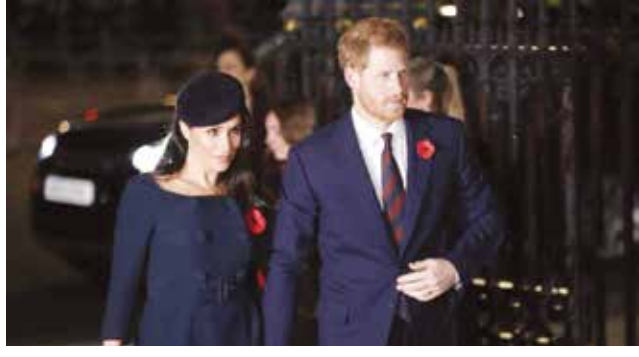
○ هاري وميغان.