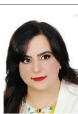
بقلم: د. وجدان فهد

السابعة والثلاثين لاستكمال مقومات الوحدة الاقتصادية والمنظومتين الدفاعية والأمنية المشتركة وبلورة سياسة خارجية موحدة. وإذا كانت البحرين منحت أولوية الاهتمام بالجوانب الدفاعية لمتطلباته الأمنية والأحداث الملتهبة في المنطقة، فإنها لم تغفل أيضاً عن الاهتمام ببناء التحالفات الاستراتيجية بين الخليج والمجموعات الاقتصادية الناهضة، فعلى سبيل المثال وقبل عشر سنوات نجحت البحرين في تنظيم المؤتمر الأول لدول مجلس التعاون والآسيان، وسوف تعمل حالياً على تعظيم الاستفادة مما تم تطويره من أدوات متقدمة للتعاون في إطار مجموعة العشرين خلال فترة رئاسة المملكة العربية السعودية للمجموعة، ولعمري إن الارتباط الوثيق للمصالح الاقتصادية مع مثل هذه المجموعات مفيد جداً في دعم قضايا المجلس في المنظمات والمحافل الدولية.