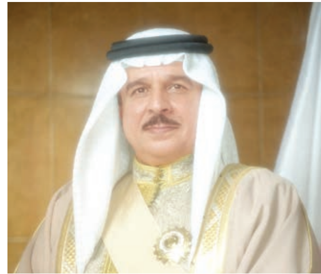
○ جلالة الملك.

جاء ذلك في تصريح لجلالة الملك المفدى بمناسبة اليوم الدبلوماسي لمملكة البحرين، والذي يصادف الرابع عشر من شهر يناير، فيما يلي نصه: