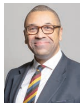
○ جيمس كليفرلي.