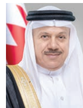
○ وزير الخارجية.

كما جرى خلال الاتصال، بحث عدد من القضايا في ظل التعاون القائم بين السلطتين التنفيذية والتشريعية لما فيه خير وصالح الوطن والمواطن في المجالات المختلفة.