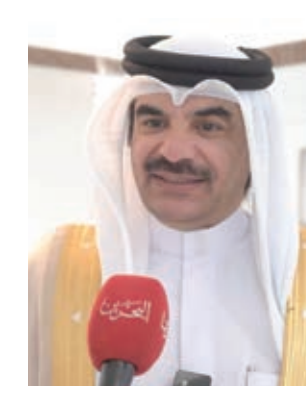
○ محمد السيبي.

وقال إن «مملكة البحرين قطعت شوطاً كبيراً في تمكين المرأة البحرينية للانخراط في مجال العمل الدبلوماسي، كما شهدت نمواً مطرداً في أعداد العاملات في هذا المجال، إذ بلغت نسبة السفيرات ١٥٪ من إجمالي سفراء المملكة، كما أصبحت تتلقت ٢٩٪ من المناصب الإدارية في وزارة الخارجية».