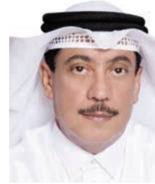
أمين عام مجلس النواب.

أكد أمين عام مجلس النواب السيد عبدالله بن خلف الدوسري الدور الرقابي والتشريعي لمجلس النواب خلال دور الانعقاد الرابع من الفصل التشريعي الرابع، وما تحقق من إنجازات ومشاريع أقرها السادة أعضاء مجلس النواب خلال الدور الأخير، مشيداً بدور جهاز الأمانة العامة في دعم وخدمة السادة النواب على المستوى الإداري والفني والتقني، والذي يعمل وفق استراتيجية واضحة المعالم، ويتوجهات مباشرة من رئيس مجلس النواب المستشار أحمد بن إبراهيم الملا لدعم السادة النواب ومعاونتهم في إنجاز مهامهم الرقابية والتشريعية، وتوفير كافة التسهيلات الإدارية والفنية واللوجستية بكل مهنية وكفاءة.