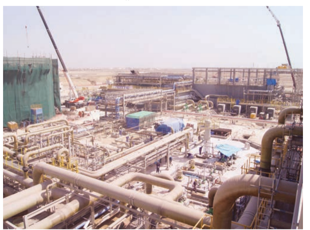
مصفاة بابكو. «أرشيفية»

يسهم مشروع توسعة مصفاة (بابكو) في رفع الطاقة الإنتاجية للمصفاة من ٢٦٧ ألف برميل يومياً إلى ٣٦٠ ألفاً. ويشمل بناء وحدة تكسير جديدة، بالإضافة إلى زيادة طاقة وحدة التكسير الهيدروجيني المعتدلة إلى ٧٠ ألف برميل يومياً. وتشير التقارير إلى أنه من المتوقع أن تتجاوز كلفة تحديث المصفاة الـ ٥ مليارات دولار، ويتوقع أن تبدأ الأعمال الإنشائية للمشروع في النصف الأول من عام ٢٠١٩م. وينصب التركيز حالياً على الأعمال الهندسية الدقيقة والمشريات مع وجود ٣ فرق مكلفة بالعمل من أجل هذه المهام خارج البحرين في روما وسيول ومدريد. كما يتوقع الانتهاء من المشروع في عام ٢٠٢١ ومن المؤمل أن تؤدي أرباح المشروع مبالغ للشركة القابضة للنفط ترحل إلى ميزانية الدولة كإرباح للقطاع النفطي. وقد نجحت المملكة في توفير التمويل الذاتي للمشروع؛ إذ تم توقيع اتفاقية مع مؤسسة تيكسيف اف إم سي الأمريكية لتزويد الخدمات الهندسية والشرائية والإنشائية للمشروع بـ ٤,٢ مليار دولار.