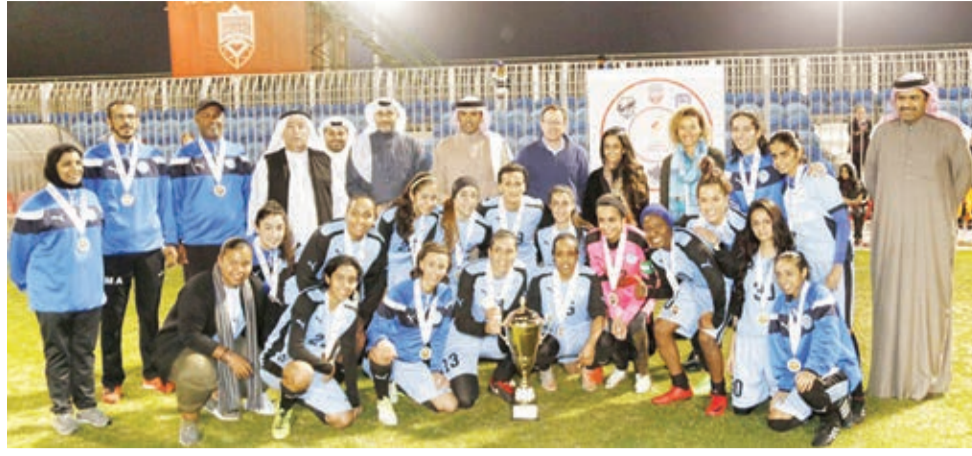
فريق riffa blue pearls بطل الدوري والكأس الموسم الماضي

يستعد الاتحاد البحريني لكرة القدم لتنظيم دوري وكأس الاتحاد لكرة القدم للسيدات للموسم ٢٠١٨-٢٠١٩، وذلك خلال الفترة ٨ نوفمبر ٢٠١٨ وحتى ٢١ مارس ٢٠١٩، ويهيئ الاتحاد البحريني لكرة القدم بالفروق الراغبة في المشاركة في البطولتين من أندية ومراكز شبابية وأكاديميات رياضية وشركات ومؤسسات؛ إلى المبادرة للتسجيل عبر خطاب رسمي للاتحاد يتضمن طلب المشاركة، على أن يكون نهاية يوم العمل الرسمي يوم الثلاثاء الموافق