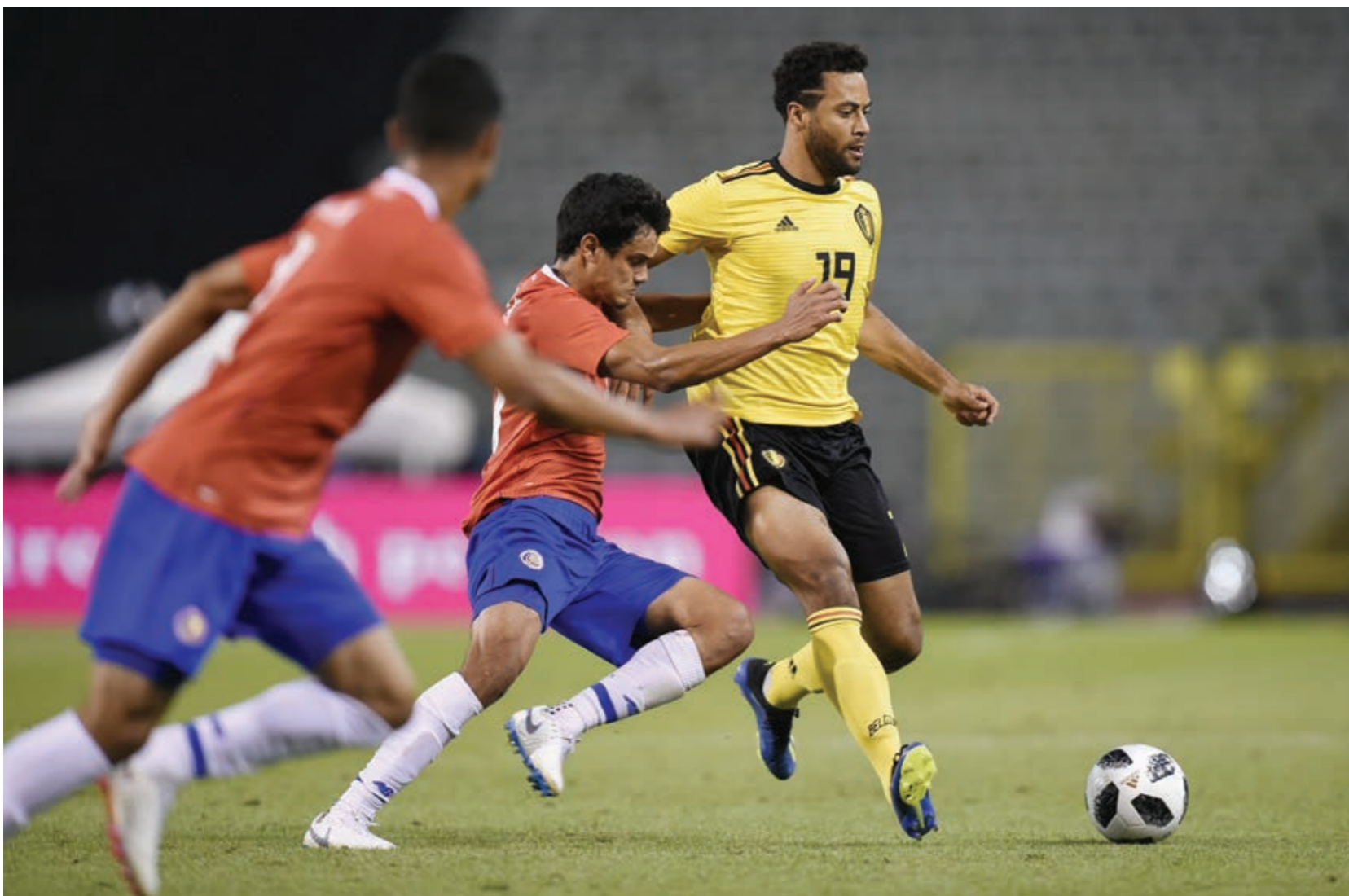
O جانب من لقاء بلجيكا وضيافة الكرواتيكي