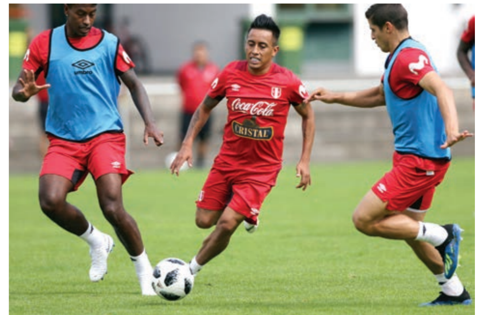
O جانب من تدريبات منتخب بيرو.

موسكو - د ب أ: أعرب المدير الفني للمنتخب النيجيري جيرينو روهر، عن خشيته من أن يكون للصيام خلال شهر رمضان تأثير سلبي على لاعبيه في بداية مشوارهم في بطولة كأس العالم ٢٠١٨ بروسيا. وقال روهر في تصريحات لوكالة الأنباء الألمانية (د.ب.أ): «في المباراة الأولى لن يكون سهلاً تفادي هذا الأمر». ويوجد عدد كبير من اللاعبين المسلمين في المنتخب النيجيري، الذين يلتزمون بأداء فريضة الصيام خلال شهر رمضان. وينتهي شهر رمضان، طبقاً للحسابات الفلكية، يوم الخميس المقبل، أي في نفس يوم انطلاق المونديال، ولكن