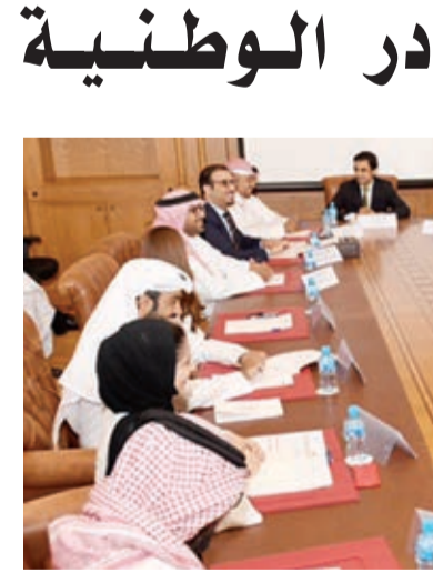
الكوادر البحرينية الطموحة للعمل في إدارتها. وفي الختام دعا الوزير

التي تركز على انتداب الكفاءات البحرينية الشابة والمتميزة من الجهات الحكومية والذي يعكس رؤية صاحب السمو الملكي الأمير سلمان بن حمد آل خليفة ولي العهد نائب القائد الأعلى النائب الأول لرئيس مجلس الوزراء لخلق كوادر وطنية قيادية مؤهلة للمشاركة في تطوير وتنمية نهضة المملكة. جاء ذلك لدى لقاء وزير المواصلات والاتصالات المهندس كمال بن أحمد محمد بأهداف برنامج النائب الأول لتنمية الكوادر الوطنية، التي تركز على انتداب الكفاءات البحرينية الشابة والمتميزة من الجهات الحكومية والذي يعكس رؤية صاحب السمو الملكي الأمير سلمان بن حمد آل خليفة ولي العهد نائب القائد الأعلى النائب الأول لرئيس مجلس الوزراء لخلق كوادر وطنية قيادية مؤهلة للمشاركة في تطوير وتنمية نهضة المملكة.