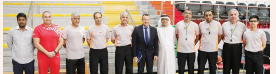
○ جهود كبيرة لاتحاد كرة السلة في التنظيم بالشراكة مع اللجنة الأولمبية

بذل مؤظفو ومدربو وفنيو وحكام الاتحاد البحريني لكرة السلة جهوداً مضنية في سبيل نجاح المنافسات وإخراجها بأفضل صورة ممكنة، وذلك ضمن حرص الاتحاد على المشاركة الفعالة في برنامج الأولمبياد