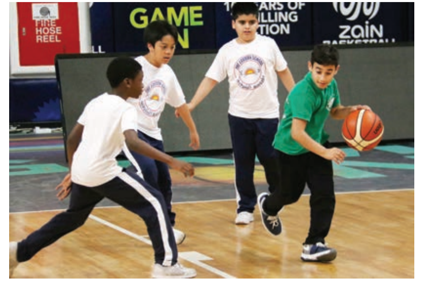
○ عروض فنية رائعة في منافسات كرة السلة الثلاثية للأولاد