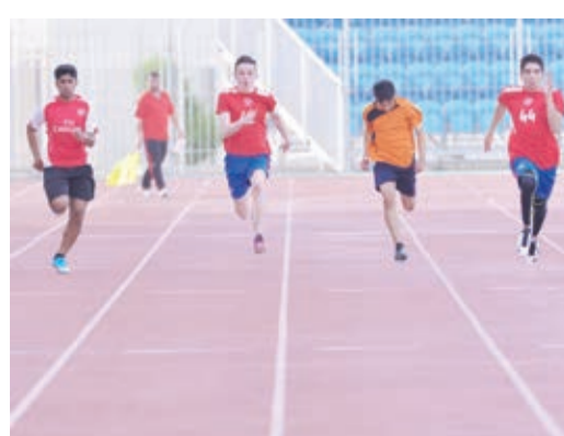
○ خاتمات مدرسية متميزة تحتاج إلى الصقل والتدريب