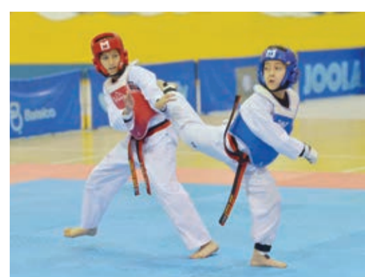
○ مواهب رائعة برزت في لعبة التايكوندو