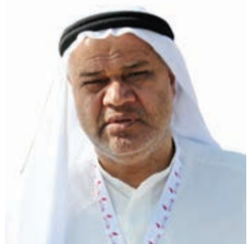
○ شبر الوداعي

الوداعي: فرصة لمزيد من الاحتكاك واكتساب الخبرة