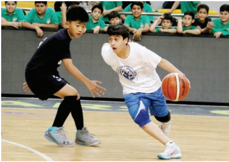
○ مراوغة رائعة من أحد الطلبة