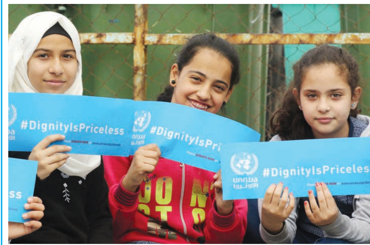
○ طالبات فلسطينيات يحملن لافتات في مدرسة تديرها وكالة غوث وتشغيل اللاجئين (الأونروا) ببلدة سبيلين في جنوب لبنان أثناء وقفة احتجاجية أمس ضد قرار الولايات المتحدة خفض مساعداتها للأونروا.