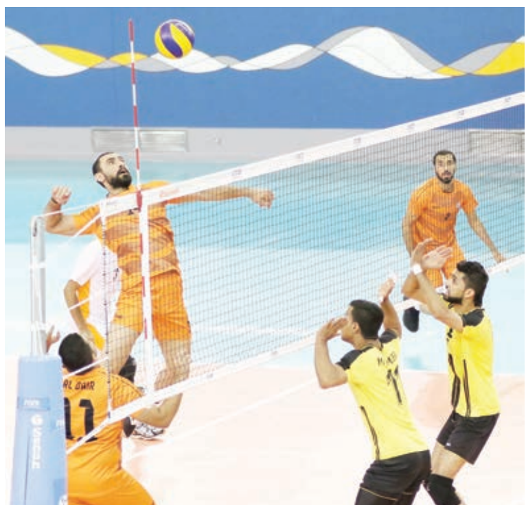
○ لقطة من منافسات دوري الدرجة الثانية لكرة الطائرة