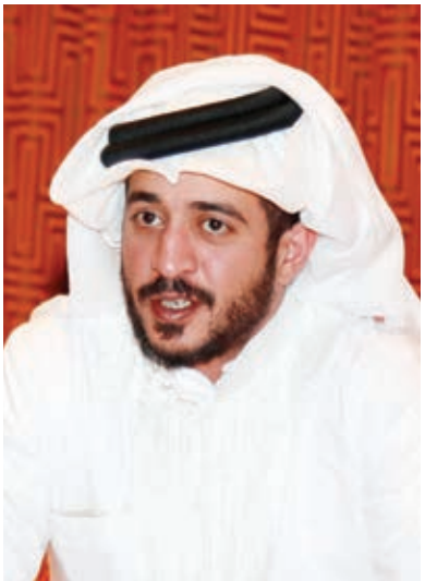
○ سمو الشيخ خالد بن حمد آل خليفة

بالدقة والإحترافية في تنفيذ خطة العمل من أجل تجهيز موقع البطولة على الشكل الذي يخدم إبران المنافسات، متمنيا سموه في الوقت ذاته كل التوفيق والنجاح للوزارة لتحقيق مزيد من النجاحات التي تخدم المسيرة التنموية في البلاد.