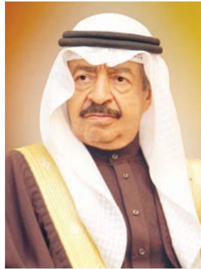
○ سمو رئيس الوزراء

والله أسأل أن يديم سموكم نخرا وسندا لوطن وشعبه.