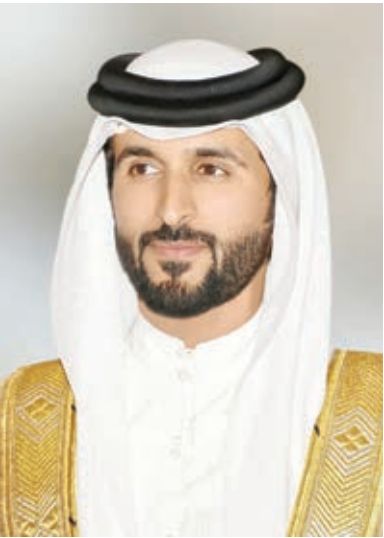
○ سمو الشيخ ناصر بن حمد آل خليفة

وتابع سمو الشيخ ناصر بن حمد آل خليفة «لقد حققت النسخة الماضية من اليوم الرياضي أهداف كبيرة وتمكننا من الوصول إلى الأهداف التي وجدت من أجلها وهو تحويل جميع مرافق المملكة إلى مراكز رياضية كاملة في مشهد متميز جدا يؤكد الارتباط الوثيق بين الإنسان والرياضة وإننا على ثقة كاملة بأن المملكة ستتحول في هذه النسخة إلى ما يكون أشبه بمراكز رياضية تمارس فيها جميع صنوف الرياضات للنساء على الإنجازات وجعل الرياضة منهج حياة متكامل».