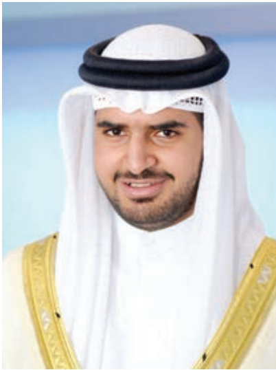
○ سمو الشيخ عيسى بن علي آل خليفة

في هذا التجمع الكروي الخليجي الهام، معاهدين سموكم على بذل المزيد من العمل والجهد لتطوير كرة السلة وترسيخ اسم مملكة البحرين في مقدمة منصات التتويج.