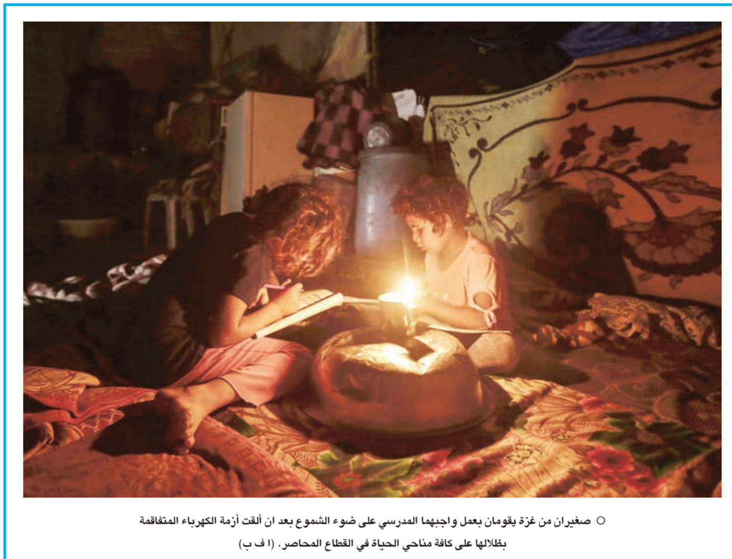
○ صغيران من غزة يقومان بعمل واجهما المدرسي على ضوء الشموع بعد أن أُلقت أزمة الكهرباء المتفاقمة بظلالها على كافة مناحي الحياة في القطاع المحاصر.

ونقلت رويترز عن عبد الناصر حميدة وكيل وزارة الصحة بمحافظة بني سويف جنوبي القاهرة «مقتل ١٥ شخصا وإصابة شخص واحد في الحادث». وأضاف أنه تم نقل تسع جثث والمصاب إلى مستشفى بني سويف العام، كما نقلت جثث ستة متوفين إلى مستشفى ناصر المركزي.