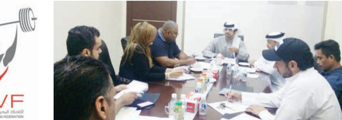
○ من اجتماع مجلس الإدارة الماضي