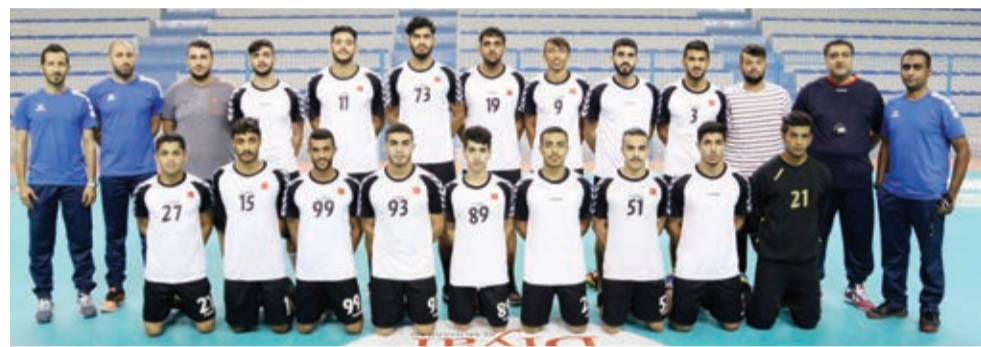
○ منتخبنا الوطني للناشئين لكرة اليد

بين أضلاع اللعبة، مشيراً إلى أن الوصول إلى هذه المرحلة مع نخبة لاعبي كرة اليد على مستوى الناشئين يضاعف من حجم المسؤولية المناطة باللاعبين في إقبات أنفسهم أمام الجهازين الإداري والفني والدخول ضمن القائمة الأخيرة المنتظر تواجدها في نهائيات كأس العالم.