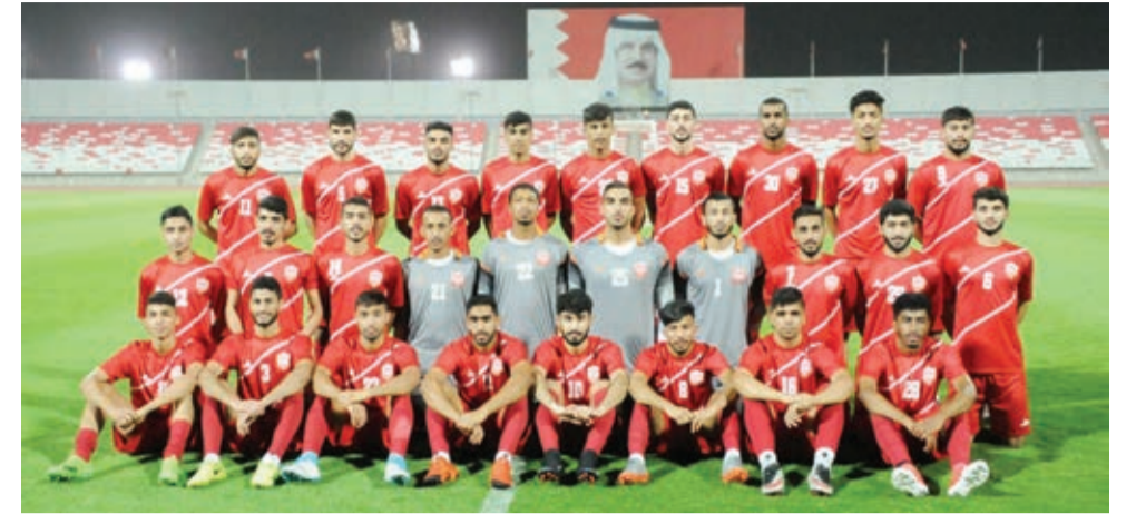
منتخبنا الأولمبي لكرة القدم