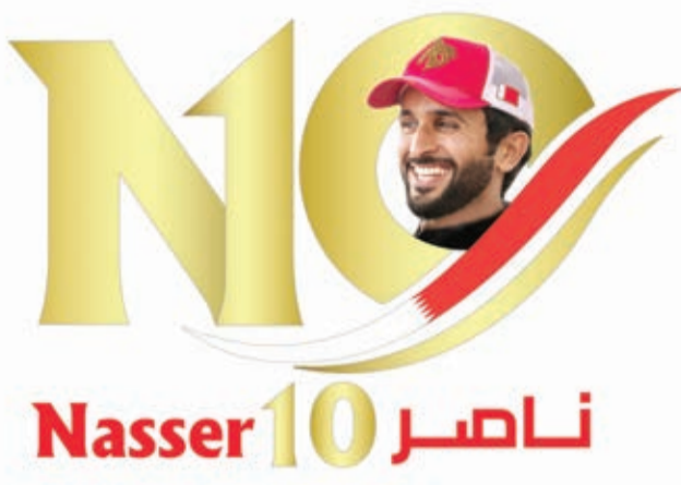
○ شعار ناصر ١٠

وقال الصالحي في تصريح على هامش الاجتماع، إن سمو الشيخ ناصر بن حمد آل خليفة كان متابعاً ومهتماً بالفكر والمقترحات التي تم نشرها في الملحق الرياضي وطرحها نخبة من الإداريين واللاعبين والمدربين، والتي كانت في مجملها تصب في خانة التطوير للدورة، مؤكداً أن سموه حريص على تطبيق تلك الأفكار والمقترحات في النسخة المقبلة بعد التنسيق مع الملحق الرياضي ودراستها بصورة جيدة وتنفيذ ما يتناسب منها مع أهداف الدورة، وأعرب الصالحي عن شكره وتقديره لفريق العمل في الملحق الرياضي بجريدة أخبار الخليج على المهنية العالية والمجهودات الجبارة المبذولة طوال تغطيتها للدورة، مشيداً في ذات الوقت بأصحاب المقترحات والأفكار التي تم طرحها.