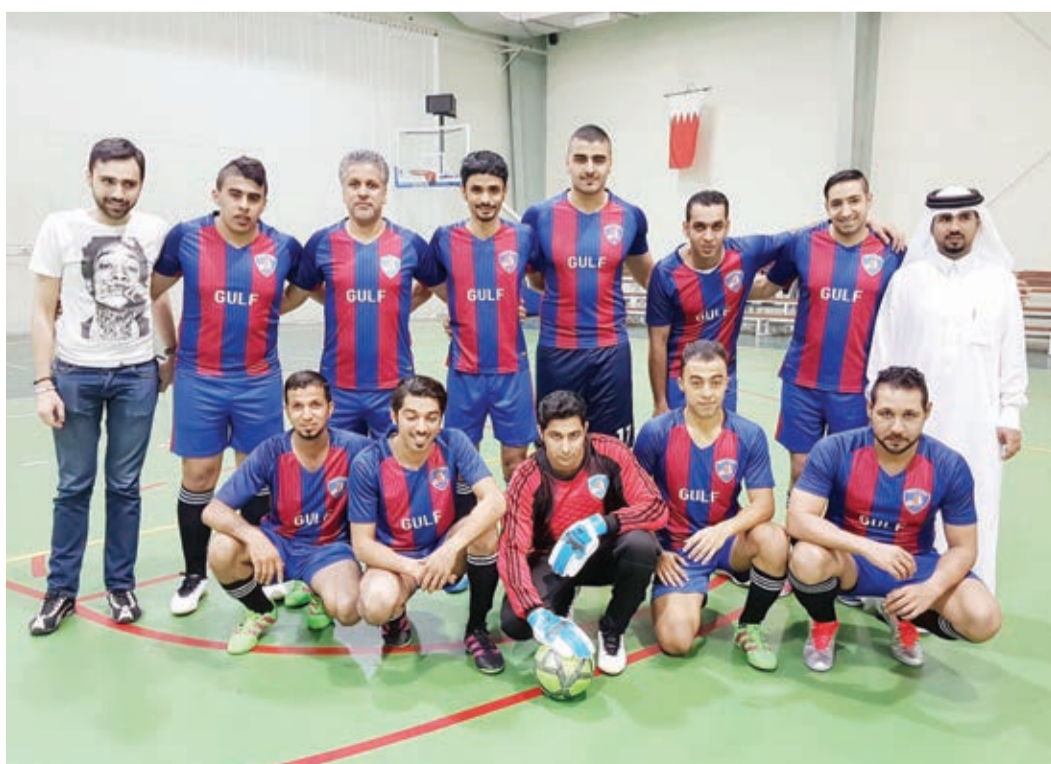
○ فريق فندق «الخليج»

تستمر منافسات الدور التمهيدي لبطولة الفنادق الثانية للصالات لكرة القدم والتي تقام تحت رعاية الرئيس التنفيذي للهيئة البحرية للسياحة والمعارض الشيخ خالد بن حمود آل خليفة بإقامة مباراتين، حيث يلتقي في مواجهة الأولى فريق منتجع «لاقونا» مع فريق فندق «الخليج» في تمام الساعة السابعة مساءً، تليها مباشرة لقاء يجمع فريق فندق «كيه» مع فريق فندق «سويس بيل» في تمام الساعة الثامنة مساءً، وذلك على صالة نادي البحرين بالمحرق.