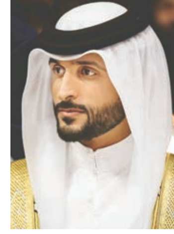
○ سمو الشيخ ناصر بن حمد آل خليفة

الحركة الشبابية والرياضية، وتنفيذاً لتوجيهات سمو الشيخ ناصر بن حمد آل خليفة، اجتمع توفيق الصالحي مع رئيس الملحق الرياضي بجريدة أخبار الخليج الأستاذ ماجد العرادي بهدف الترتيب لعقد